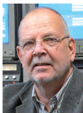
Beratungspartner in Medienfragen