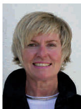
Beratungspartnerin für GS, FÖ, GY