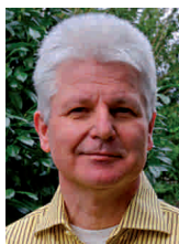
Beratungspartner für die HS, RS, GE